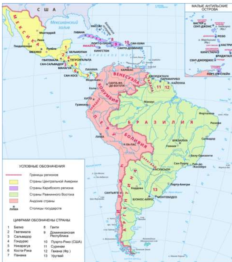
Рисунок 1. - Субрегионы Латинской Америки

Англоязычные страны — Ямайку, Барбадос, Багамы, Белиз и другие — часто не относят к Латинской Америке.