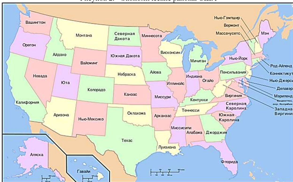
Рисунок 3. - Административно-территориальное деление США